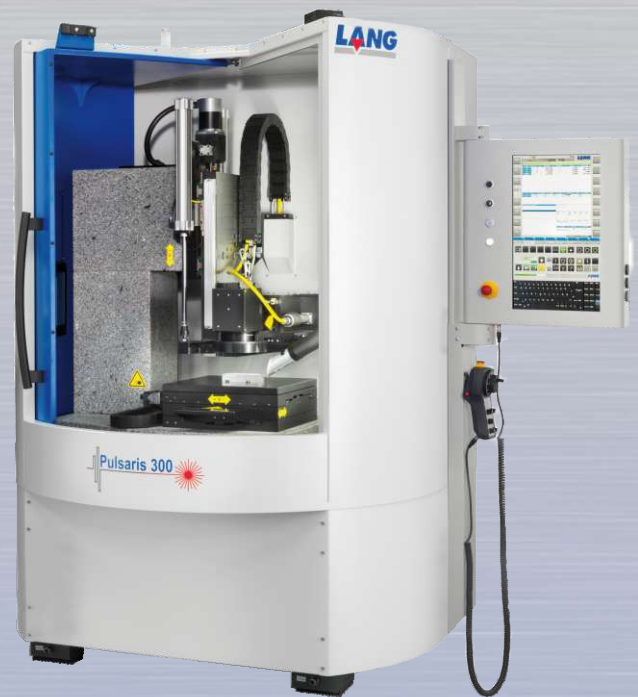
Pulsaris 300 Laser Graviermaschine

Sie möchten den Regenbogen-Effekt sehen?