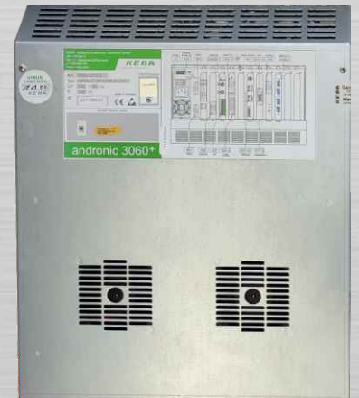
für Ihre vorhandene LGT / LGT-S